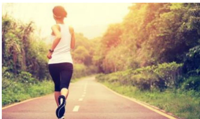
Quando hai fame corri più veloce