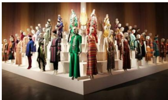
Quando la moda diventa arte