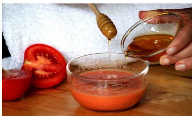
Maschera al pomodoro